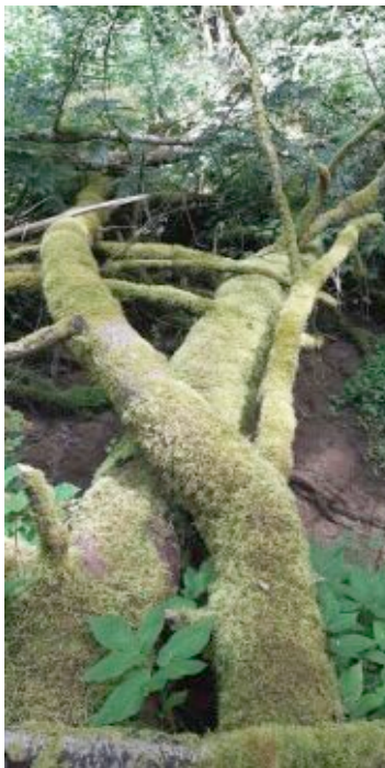
Hier hat das Moos ganze Arbeit geleistet.

zum Wanderparkplatz zurück. Unterwegs zeigen sich an Sommertagen immer wieder Schmetterlinge wie Admiral, Schachbrettfalter und Kleiner Eisvogel. Am Ziel angekommen lohnt ein Pauschen auf einer Himmelsliege mit Blick über die Baar-Landschaft. Sylvia Pabst